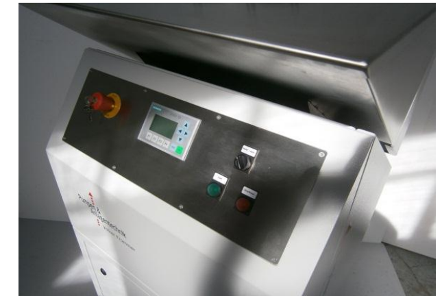
Bedienfreundliches Handling über Textdisplay und Taster

Mit der Standard SGP-Baureihe werden Förderleistungen bis zu 2,5 t/h erzielt. Durch Kopplung von mehreren SGP's kann die Förderleistung vervielfacht werden.