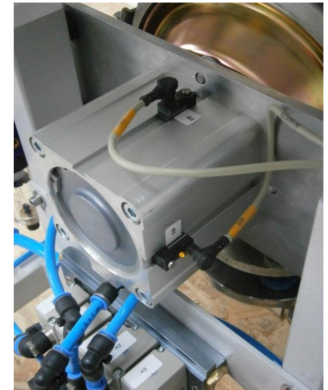
Pneumatiktrieb mit Steuereinheit