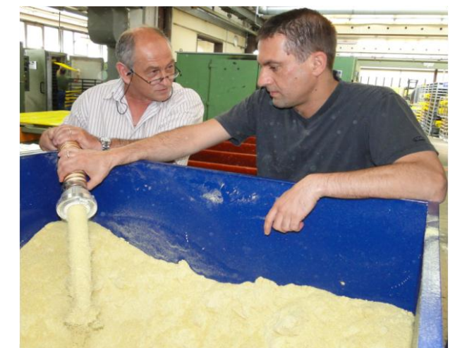
Staubarmer und pulsationsarmer Mediumsaustritt